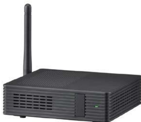
IT ユニバーサルボックス<SC-BX2>